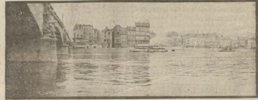
Müstahkem Liyej şehrinin Möz sahilinden görünüşü