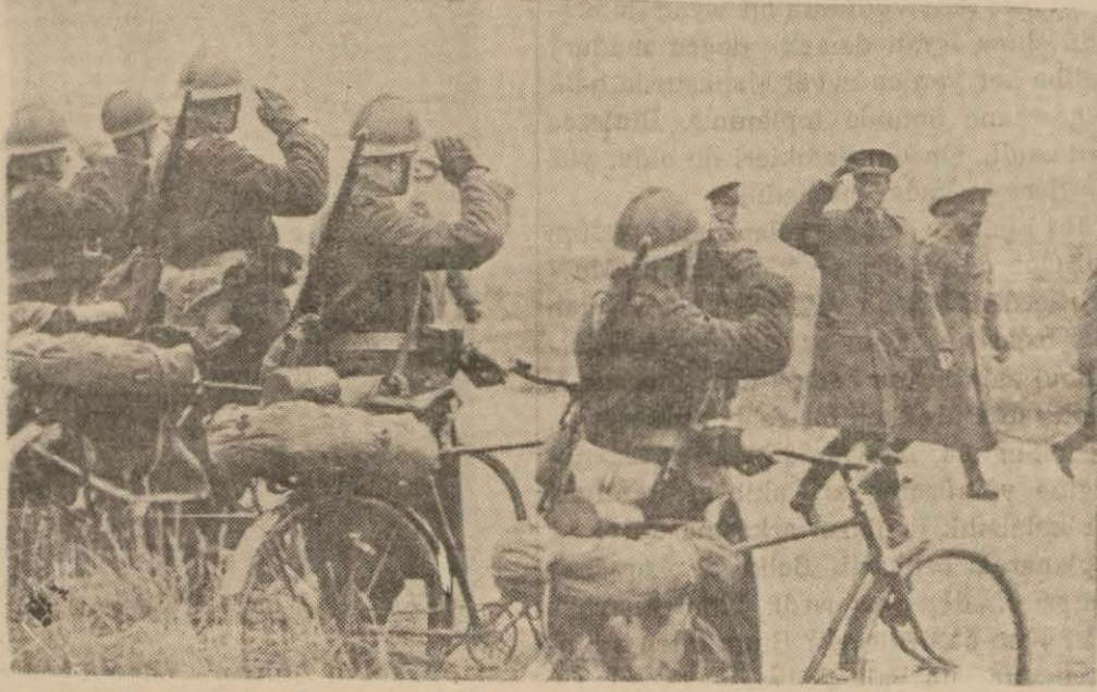
Belçika kralı Leopold Belçika ordusunun bisikletli kutaatını teftiş ederken

göre Belçika ordusu sağ kanadile Malmédy havalisinden geriye Liege - Namur - Mons müstahkem hattına doğru umumî bir ric'at yapmaktadır. Bu takdirde bu hat ile Lüksemburg arasına girecek olan Alman ordusu Fransız Majino hattına ve Fransız ordularına hem yanını ve hem de gerisini vermiş olacaktır ki bu, müttefiklere çok büyük ve muvaffakiyetli bir mukabil taarruz imkân ve fırsatını vermektedir.