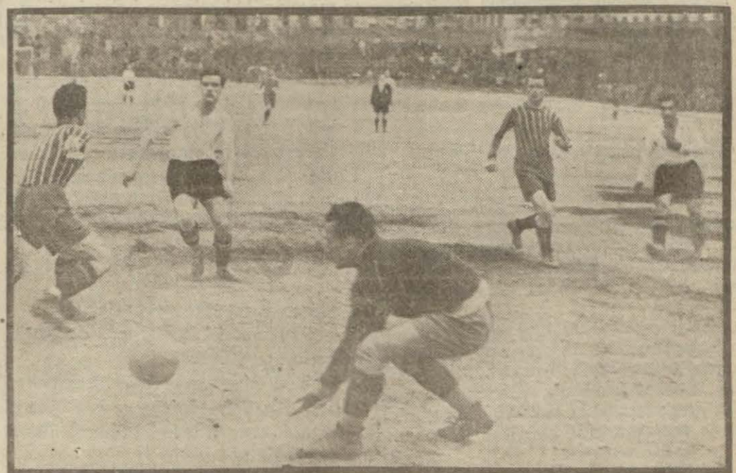
Dünkü Fener - Beşiktaş maçından heyecanlı bir sahfa

(Dünkü maçlara aid yazılarımızı 6 nci sayfamızda bulacaksınız)