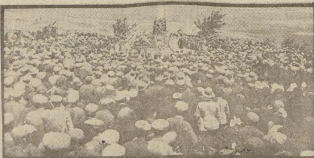
İnönü şehidliğinde yapılan merasimden bir intiba (Yazısı 2 nci sayfa)