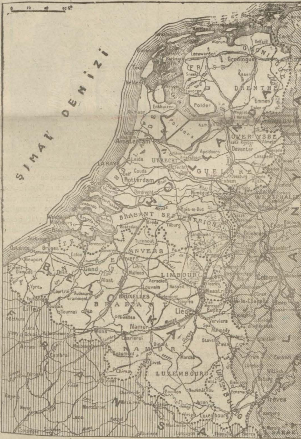
Belçika ve Holandada hareket sahalarını gösteren harita